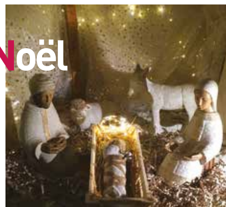
► La crèche aurait été instaurée par François d'Assise.

La tradition de la crèche de Noël, telle que nous la connaissons, aurait été instaurée par saint François d'Assise au début du XIII e siècle. En 1223, François d'Assise organisa une crèche vivante dans son église à Grechio, en Italie, avant de célébrer la messe de Noël. Au Moyen Âge, des pièces de théâtres et tableaux vivants