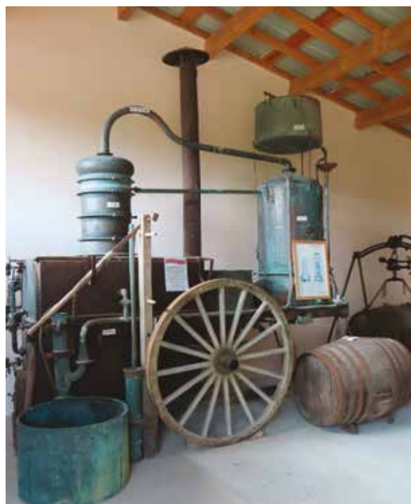
► L'alambic du musée du paysan gascon, à Toujouse.

« Mon frère faisait fonctionner un alambic ambulante (fabriqué en 1921 à Estang pour le compte de notre oncle de Mauléon) qui servait pour un « atelier public » en même temps qu'il se déplaçait chez le producteur souhaitant distiller son vin. Avec 100 litres de vin on obtenait environ 20 litres d'eau-de-vie d'armagnac qui coulait limpide, claire avec ses 50 °C à 52 °C d'alcool qu'on mettait dans des fûts de chêne: si la barrique était neuve, il ne fallait pas l'y laisser plus d'un an sinon le tannin donnait un goût de bois désagréable. Si l'on voulait la conserver blanche, il fallait la mettre dans des bonbonnes de verre où elle n'évolue plus. La distillation et la commercialisation de l'armagnac étaient étroitement surveillées par l'administration fiscale (les contributions indirectes) qui pouvait procéder à tout moment à des contrôles de qualité (teneur en alcool), quantité de vin à distiller et d'eau-de-vie obtenue, et quantités stockées. Toute erreur était considérée comme une tentative de fraude, donc durement sanctionnée par des amendes. »