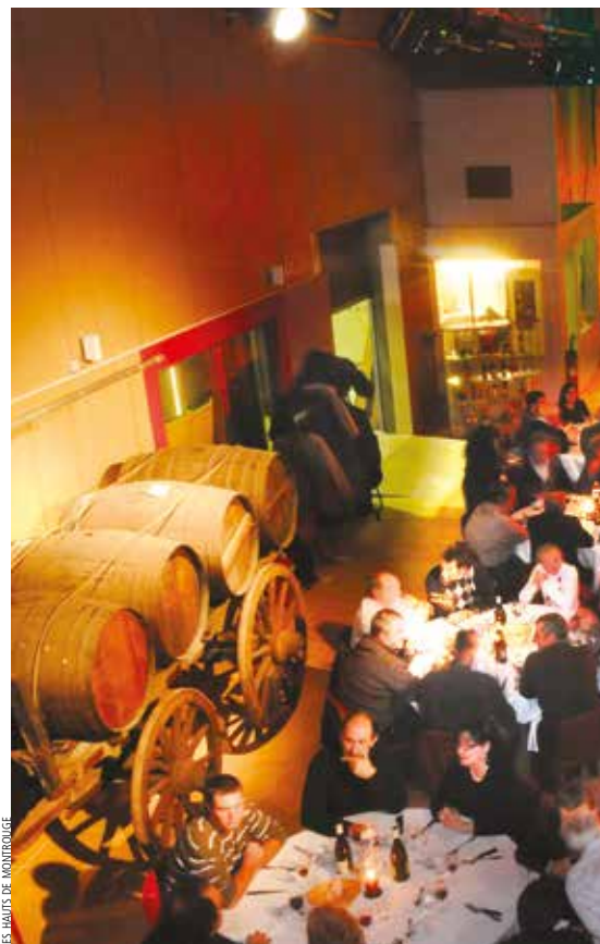
► Repas dans le chai.