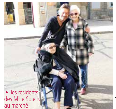
► les résidents des Mille Soleils au marché

des années et peu de visages nouveaux viennent assurer la relève. Selon la conclusion d'une récente émission télévisée « Prêt pour les autres » j'ajouterais que le partage est toujours une source de plaisir pour celui qui reçoit et pour celui qui donne.