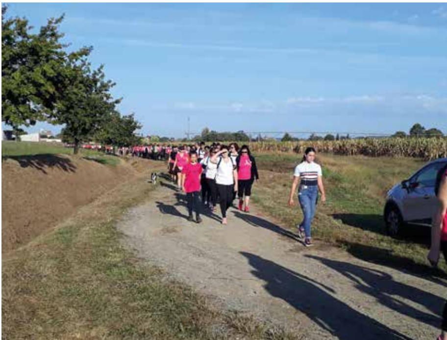
► La marche a permis de récolter la somme de 7650 euros au profit de la Ligue contre le cancer.

C'est avec un grand plaisir que nous vous annonçons la grande réussite de la journée du 13 octobre 2019. Le soleil, les marcheurs et la bonne humeur étaient au rendez-vous. Pour la cinquième année, le résultat a dépassé toutes nos estimations. 720 marcheurs sont venus découvrir de nouveaux parcours. Cette année, nous avons rajouté des petites séances d'échauffement avant chaque départ. Grâce à l'ensemble des bénévoles et des participants, l'événement a été un franc succès. Ce qui aurait été impossible sans toutes les précieuses personnes qui ont donné de leur temps.